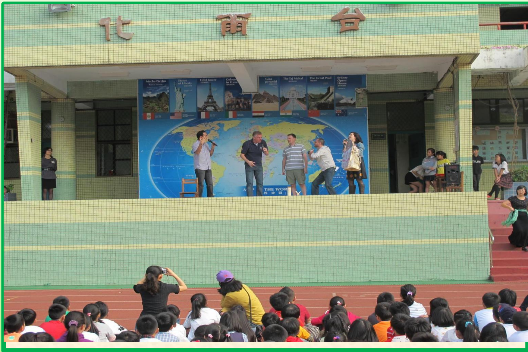
學生朝會 晨光英語時間