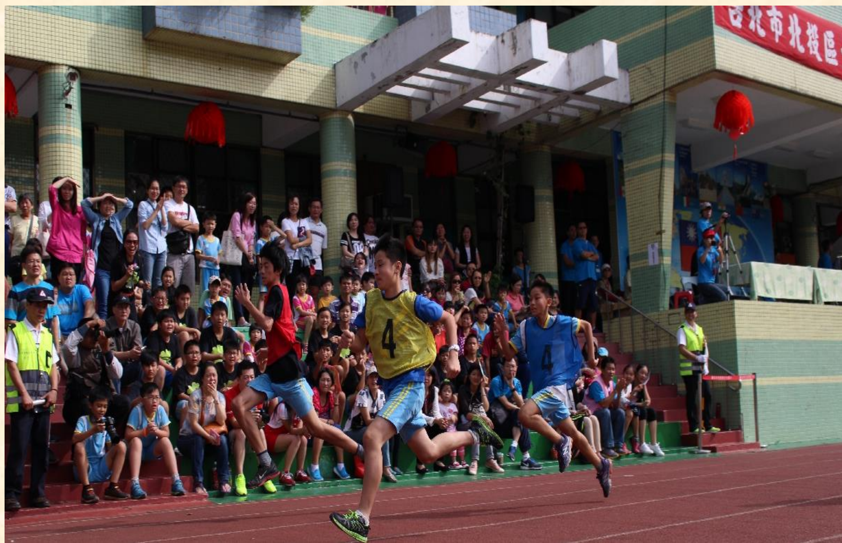
體育表演會 學生徑賽