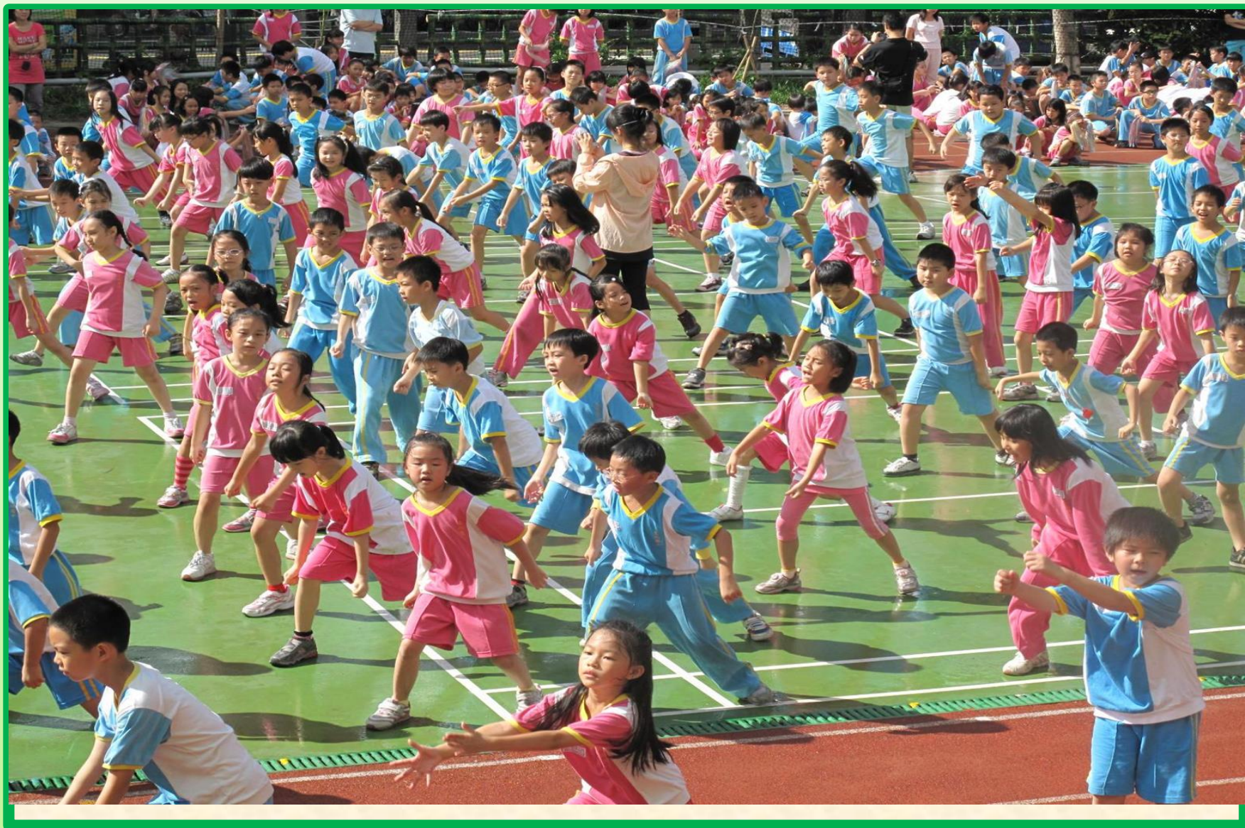
體育表演會 學生表演