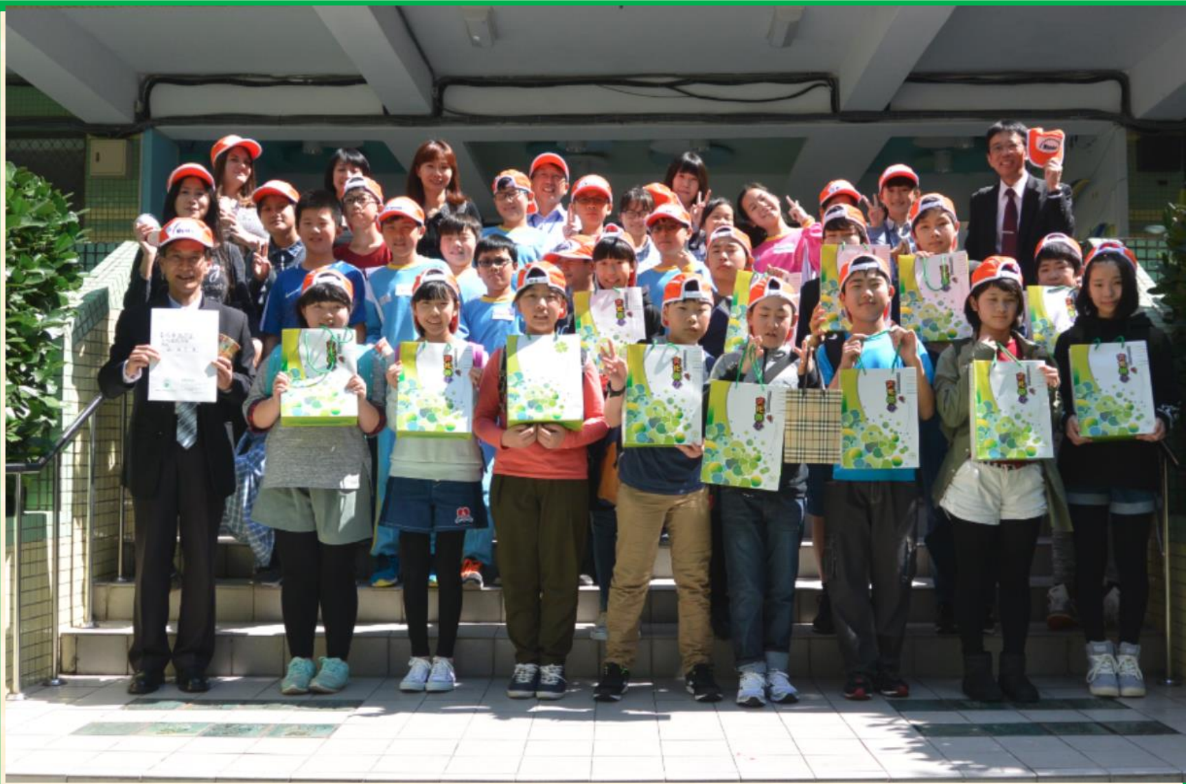
日本妙高市新井南小學來訪