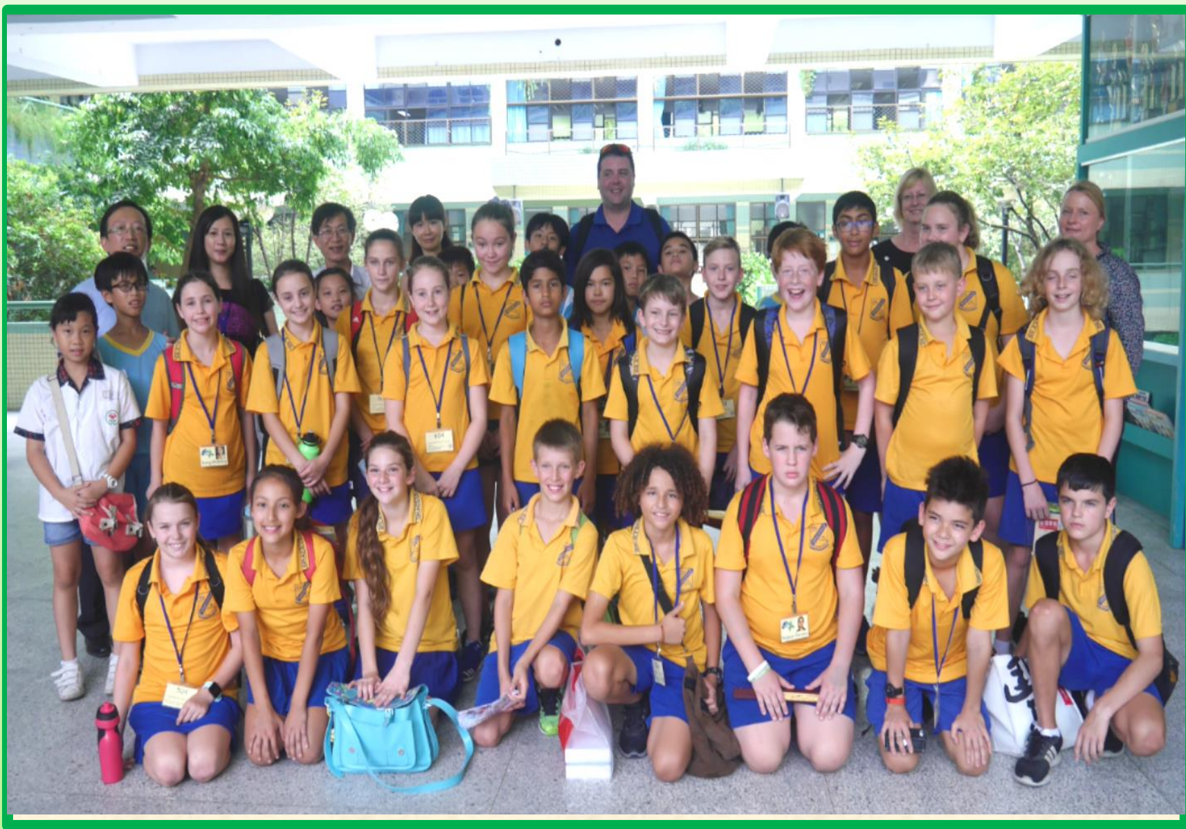
澳洲學生回訪遊學交流